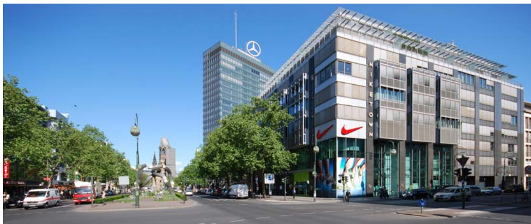
Foto: Berlin, Niketown auf der Tauentzienstraße

Der Berliner Kurfürstendamm und in dessen Verlängerung die Tauentzienstraße sind die wichtigsten und bekanntesten Einkaufsboulevards in Berlin. Der für Filialbetriebe und internationale Modemarken interessante Bereich erstreckt sich vom KaDeWe (Kaufhaus des Westens) an der Tauentzienstraße bis zum Olivaer Platz am Kurfürstendamm. Der Standort besticht durch ein vielfältiges und heterogenes Angebot, das von der Kaufhausrennbahn am Tauentzien bis hin zu den Luxusanbietern im mittleren Teil des Kurfürstendamms reicht. Die höchsten Passantenfrequenzen werden an der Tauentzienstraße bis zum Kurfürstendamm/Ecke Joachimstaler Straße gemessen.