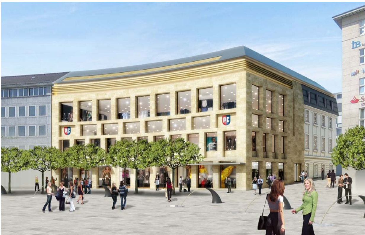
Visualisierung des neuen P&C-Gebäudes am Königsplatz

Am Standort des früheren Modehauses Overmeyer, am Königsplatz 40, soll ein modernes Geschäftshaus realisiert werden. Die Umbauarbeiten werden nach Angaben des Eigentümers, der Göttinger Grundinvest Kö GmbH, voraussichtlich im Herbst 2010 beginnen. Der Zeitplan für das 2.500 m 2 Verkaufsfläche umfassende Haus sieht eine Eröffnung im Jahr 2011 vor.